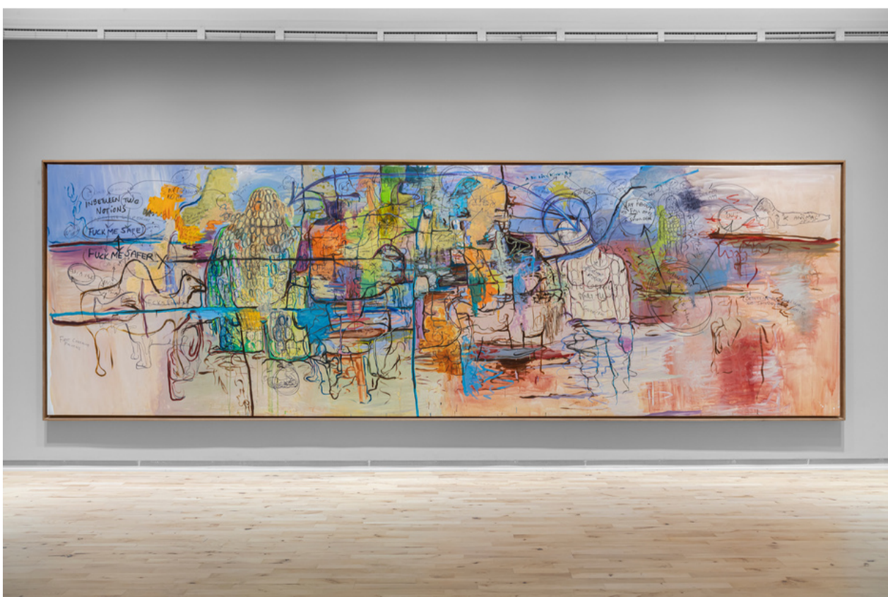
Bjarne Melgaard: Fuck Me Safer, 1995-1999, maleri. Christen Sveaas Kunststiftelse

Fuck Me Safer (1995-1999) er dessuten tittelen på et seks meter bredt maleri [red.bildet under], sentralt i utstillingen, og en lignende spenning mellom to relativt like, men likevel forskjellige betydninger preger hele maleriet. Bildet kan deles i fire deler som til en viss grad speiler hverandre. Nede til høyre imiterer malingen sølepytter av gjennomslittige røde- og rosafarger, og disse pyttene lager unøyaktige refleksjoner av områdene over og omkring. To skjellete, menneskelignende mannsfigurer, står på hver sin side av et område med intense vekselvirkninger mellom komplementærfarger, et slags kaotisk rutenett i oransje, blått, spygrønt og hudfarger. De mange linjene og konturene antyder figurer og skjemaer som likevel løser seg opp og renner som våt maling nedover bildet.