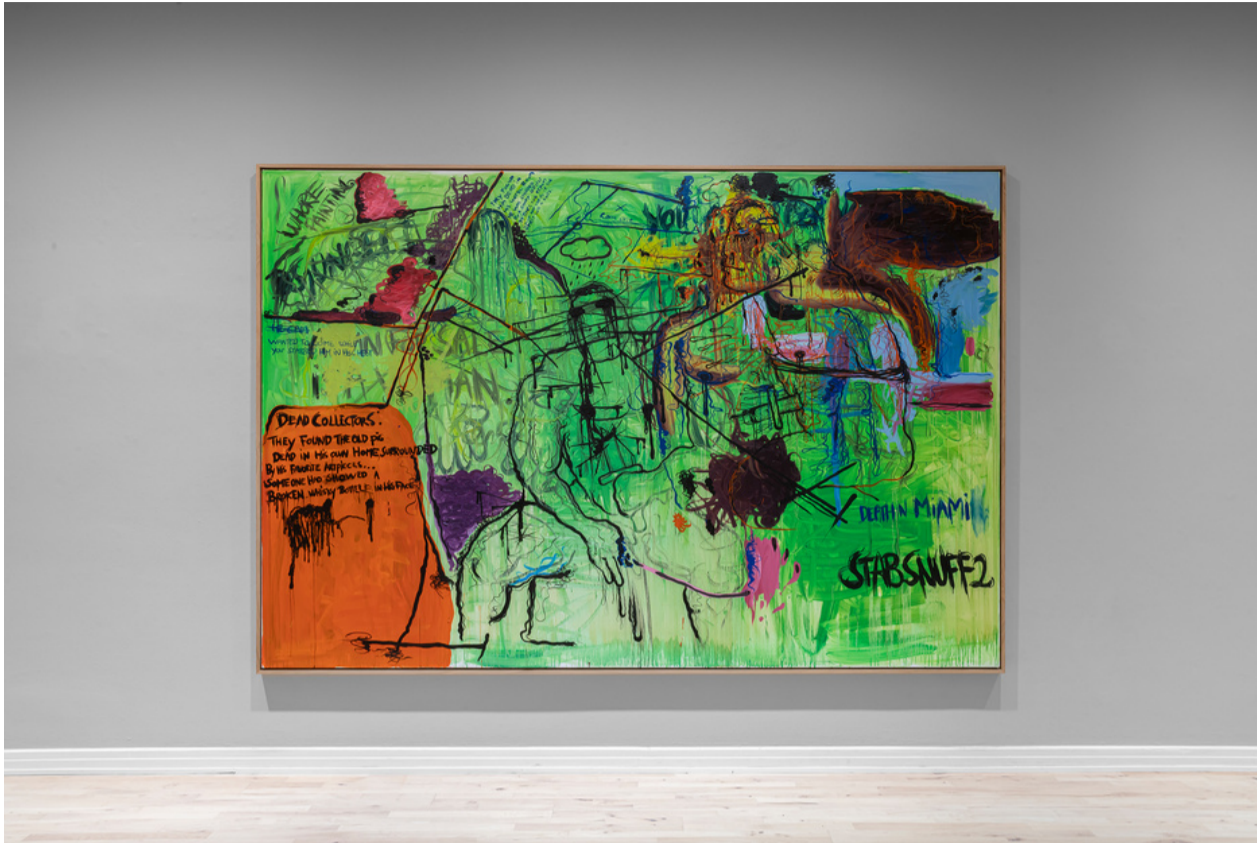
Bjarne Melgaard: Untitled (Stabsnuff) , 2004, maleri © Bjarne Melgaard / BONO 2022.

og slik det første maleriet foreslår, kan det være hensiktsmessig å ikke henge seg opp i dette uttrykkssterke innholdet, men heller anse figurene og skribleriene som en slags sceneanvisninger, som forteller om hvilket sosialt og diskursivt univers vi befinner oss i.