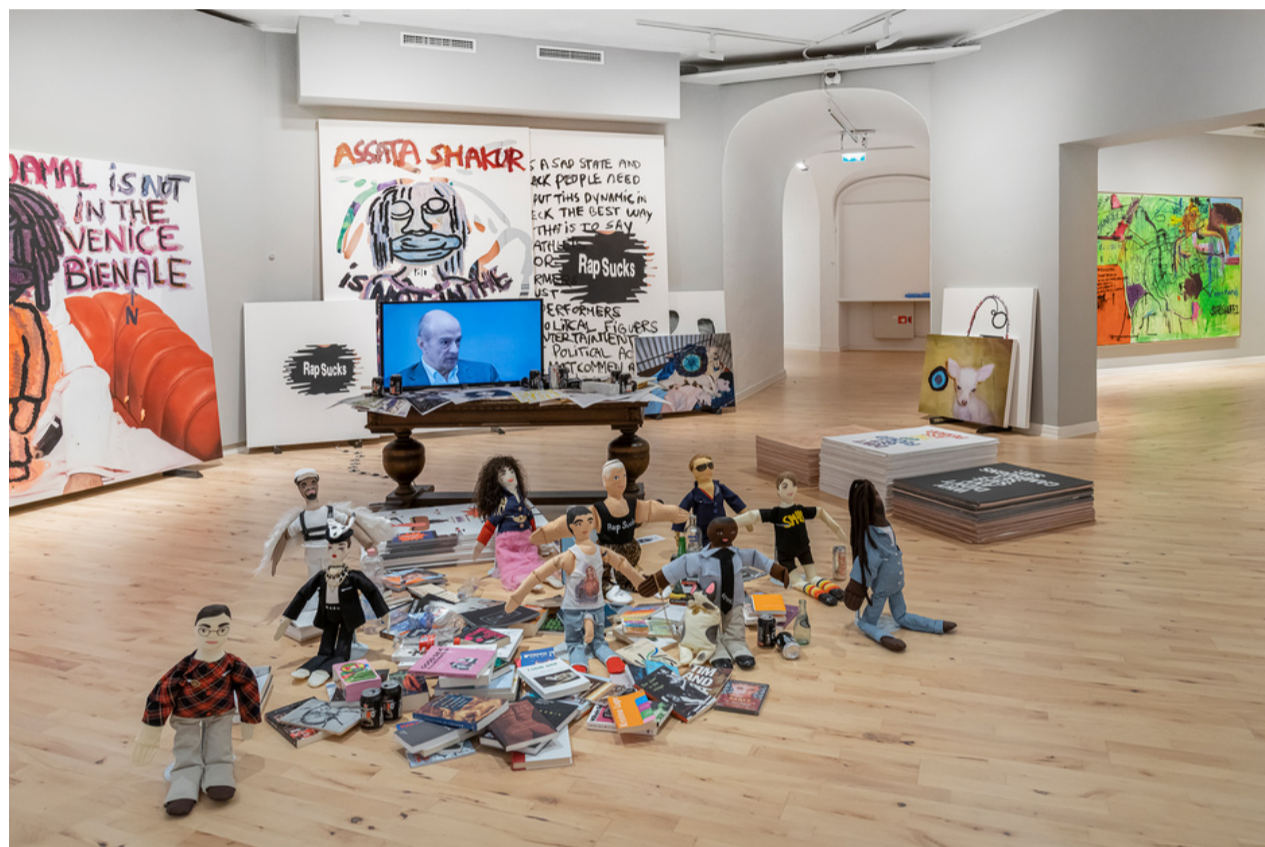
Fra utstillingen Bjarne Melgaard Fuck Me Safer på Haugar kunstmuseum. Bjarne Melgaard: Baton Sinister , installasjon © Bjarne Melgaard / BONO 2022. Haugar kunstmuseum.

Maleriets gardinmetafor, plassert her i begynnelsen utstillingen, kan leses som en oppfordring til å trekke til side og se forbi all «støyen», altså de perverse figurene og utagerende tekstfragmentene som vanligvis bebor Melgaards malerier. Ved å åpne med dette nonfigurative maleriet inviterer utstillingen til å se bort fra bildenes provokative innhold; og i forlengelsen av dette, forsøke å skrelle vekk lagene av kjendiseri, romantisering av rusbruk, den kommersielle suksessen og flørtingen med putetrekk og NFT-kunst som omgir Melgaards kunstnerskap, dette for å kunne se bildene på nytt, eller se dem i det hele tatt.